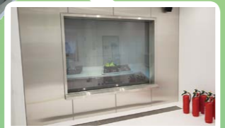
初期消火体験 とっさの火の消し方