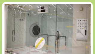
暴風雨体験 台風や豪雨の怖さ