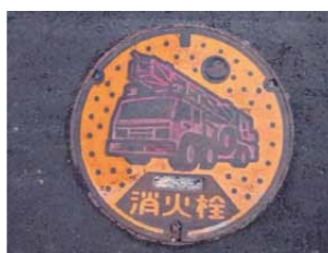
車道に設置されている消火栓

「消防水利」とは、消火活動を行う際に使用する施設のことです。主なものとして、消火栓、防火水そう、プール、河川、池などがあります。「消火栓」や「防火水そう」は車道や歩道などに設置されており、その位置が一目で分かるよう標識(看板)も設置されています。消防水利の付近に車両が駐車してあると、いざというときに、消火活動ができなくなる恐れがあります。そこで、消防水利の標識および防火水そうの取水口から5m以内は車両駐車禁止が、道路交通法により定められていますので、協力をお願いします。