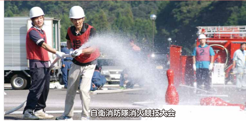
自衛消防隊消火競技大会