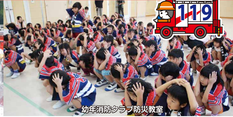
幼年消防クラブ防災教室

【編集】= 消防局予防課 / http://www.satsumasendai-fd.jp