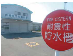
防火水そうの標識