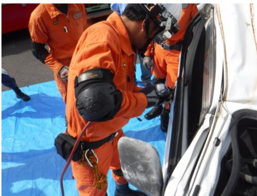
エアーカッター使用