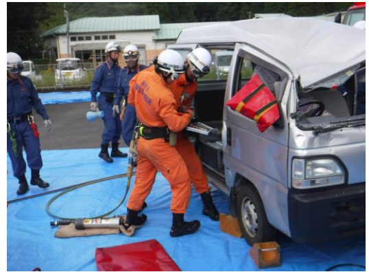
救助隊によるドア開放