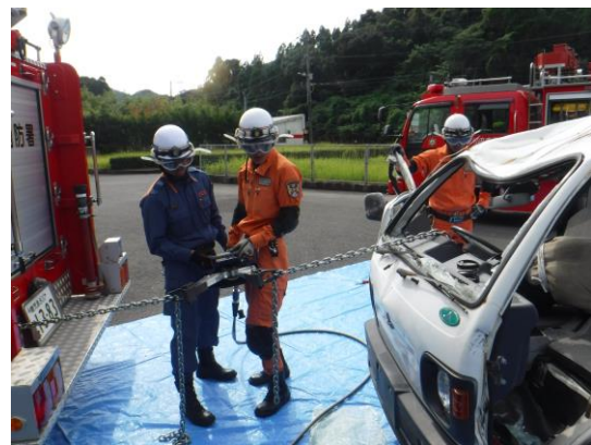
消防車固定による牽引チェーン使用