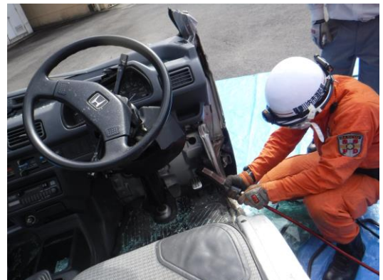
ペダルカッター使用