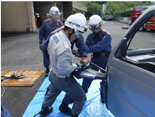
西部署員によるドア開放