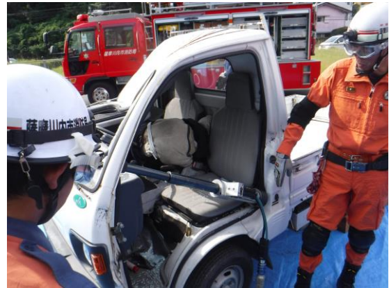
ラムシリンダー使用