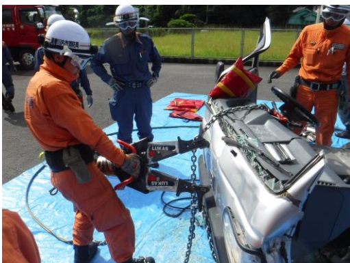
牽引チェーンセット使用