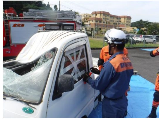
窓ガラス破壊要領