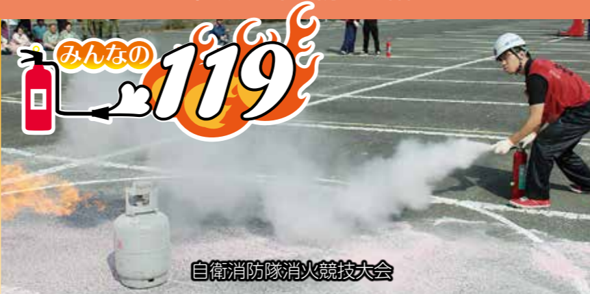
自衛消防隊消火競技大会