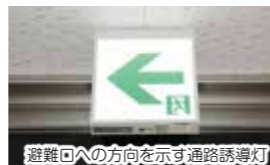
避難口へ方向を示す通路誘導灯