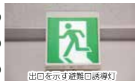
出口を示す避難口誘導灯

「誘導灯」は、火災が発生したときに建物内にいる人が安全に避難できるよう、主要な出入口などに設置される消防用設備で、「避難口誘導灯」「通路誘導灯」「客席誘導灯」の3種類があります。誘導灯は常時点灯が原則で、停電の場合でも内蔵する電池により点灯し、暗がりの中でも誘導灯の光を頼りに避難することができます。誘導灯が設置されている事業所では、電灯の玉切れや、内蔵電池が有効に作動するかなど定期的な点検が不可欠です。また、旅行や出張、買い物などで初めて訪れるような建物では、必ず「誘導灯」により避難口を確認しておきましょう。