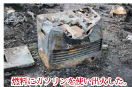
燃料にガソリンを使い出火した。