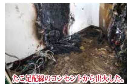
たこ足配線のコンセントから出火した。