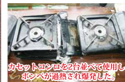
カセットコンロを2台並べて使用し、ボンベが過熱され爆発した。